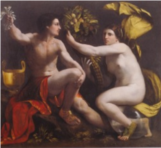
Abb. 21. Dosso Dossis, Allegorie der Fortuna mit in der Hand gehaltenen Papierstreifen, der sogenannten Lottobündel.

Die Imprese der Tempi und Pausen Abb. bestünde nach den genaueren Analysen aus einem C-Schlüssel, vier übereinander stehenden Zensurzeichen für verschiedene Tempi und mehreren symmetrisch angeordneten Pausenzeichen und einem Wiederholungszeichen. Bedeuten die Tempi den Lauf der Zeit, dann stehen die Pausen für "Schweigen" und die in unendlicher Wiederholung. Die Zeit gut zu nützen und sich des Silentiums zu bemächtigen, sind Maxime des Studiums, des kontemplativen Menschen. Isabella war sich über die